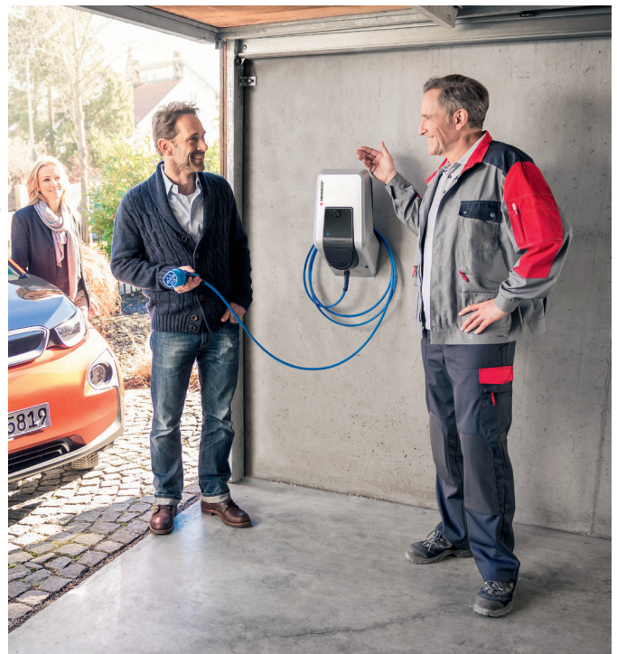
Ladestationen, Ladekabel und Zubehör unter www.ferratec.ch